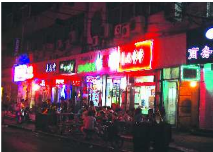
晚上将近十一点,楼下的烧烤摊正热闹。

“吃烧烤确实是咱济南人的特色,烧烤摊确实也给很多人带来了方便,可是烧烤摊能不能别紧挨着居民楼。再说晚上十一二点还不收摊,太影响居民休息了。”老李无奈地说道。