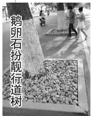
鹅卵石扮靓行道树

近日,临沂对市区主干道、人行道进行了美化,使绿色长廊变得更加靓丽。图为临沂人民广场附近用鹅卵石装饰的行道树。