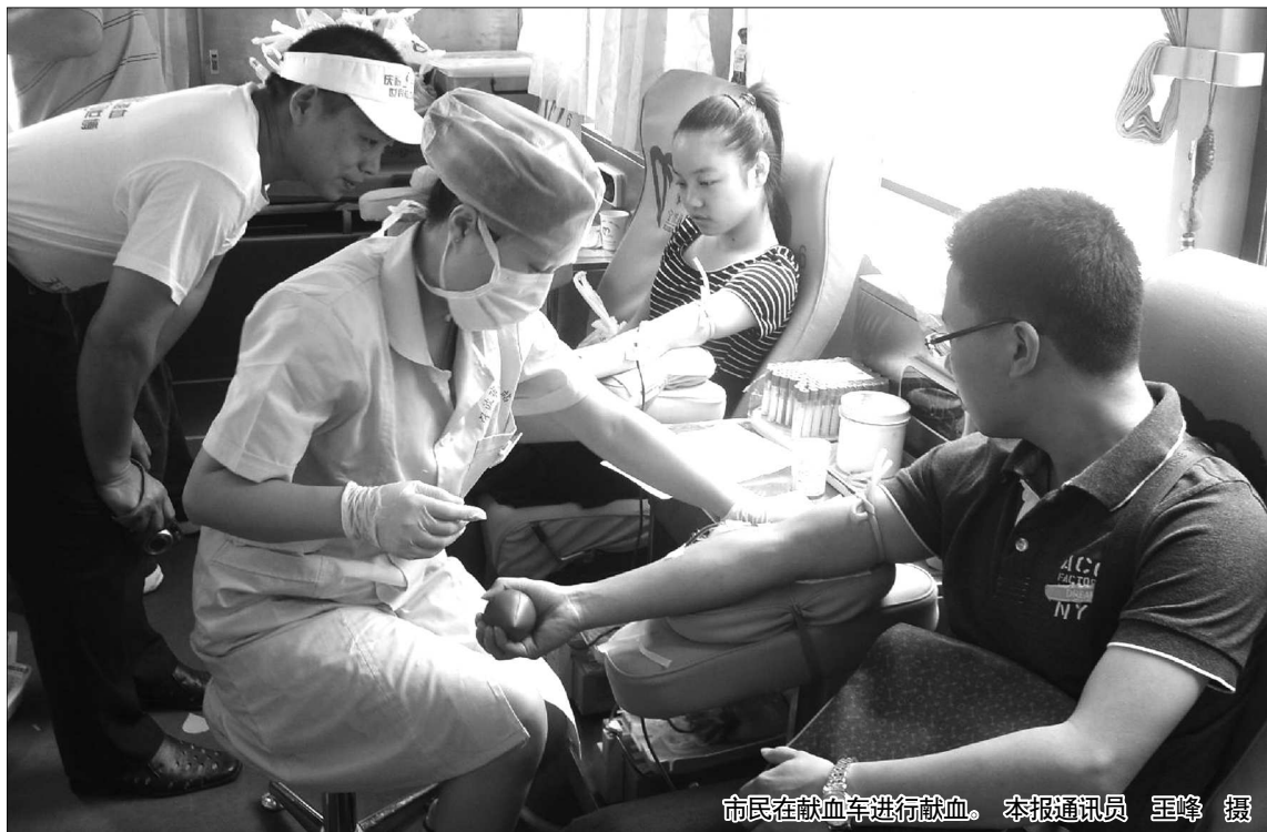
市民在献血车进行献血。

本报泰安 6 月 14 日讯(见习记者 周倩倩) 14 日是世界献血日,在泰城街头流动献血点,很多志愿者和社会组织自发走上街头进行无偿献血。据泰安市中心血站统计,当天约有 180 人参与了无偿献血活动。