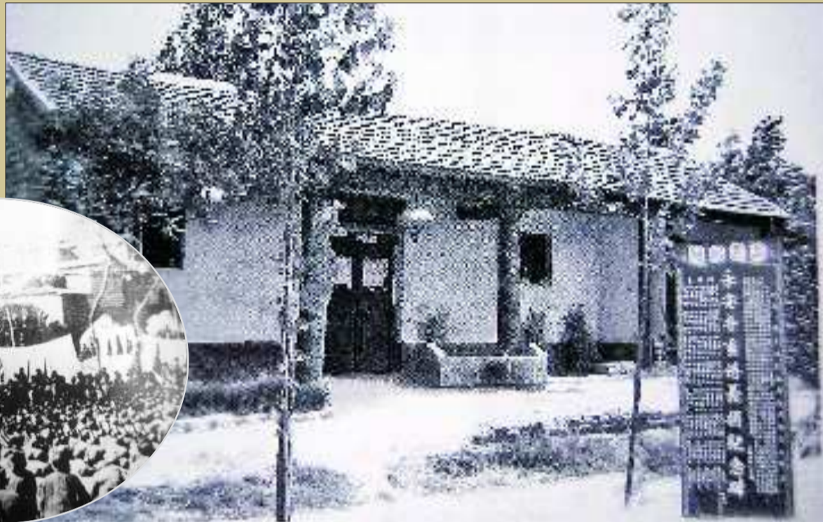
▼1939年3月22日，陈伯衡在战斗中牺牲，八路军一一五师、鲁西区党委在东平常庄为他举行追悼大会(资料片)。