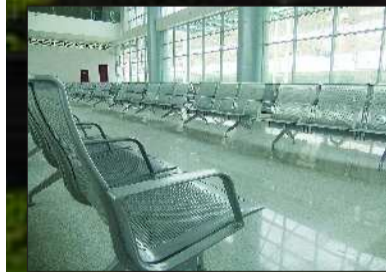
枣庄站大厅一侧的乘客座椅。