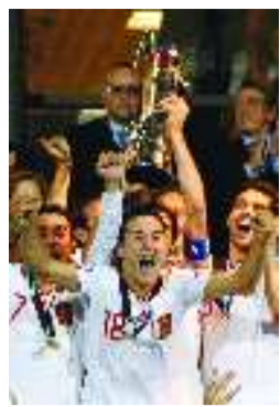
6月25日,西班牙队球员庆祝夺冠。当日,2011年U21欧青赛决赛在丹麦奥胡斯市举行,西班牙队以2:0战胜瑞士队,夺得冠军,这也是西班牙队第三次夺魁。

有消息说,莱昂加盟鲁能时,先与球队签订了半年的工作合同,后来又续了半年。如果真是这样,6月底就是莱昂与鲁能合同到期的时候。届时,鲁能将他换走,也是顺理成章的事情。