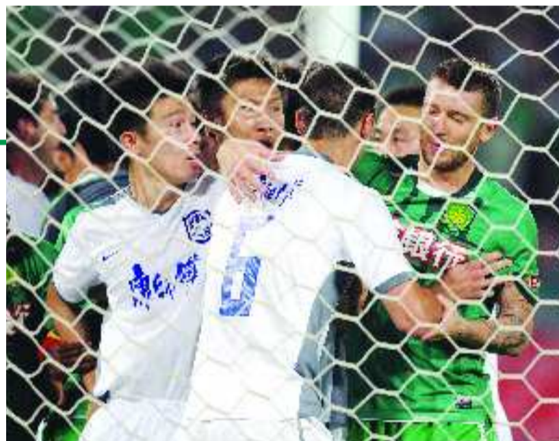
6月26日,因天津泰达队进球被判无效,北京队与天津队球员在球网内争执。

其他场次的比赛都进行得波澜不惊,上海申花队客场2:1战胜大连实德以及青岛中能主场0:1负于长春亚泰队,都在意料之中。如今的中超联赛,实力不济的队伍还真的很难有爆冷的机会。