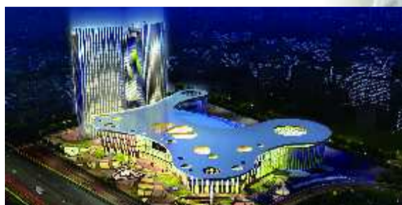
长途客运枢纽效果