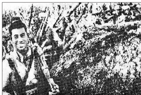
▲1947年5月11日,华野部队在击退国民党5个整编师增援的同时,向孟良崮进行猛烈攻击,全歼国民党整编74师共3.2万人,击毙师长张灵甫。图为孟良崮战役胜利结束,英雄们凯旋。