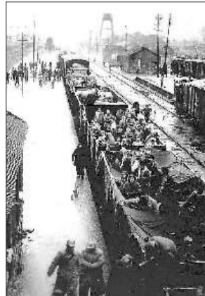
▲解放战争期间,为配合人民解放战争,全国十几个批次、近20万地方干部别妻离子、风餐露宿下江南,为北方根据地的稳定、为南方新区的开辟、为共和国的最终建立和巩固,做出了巨大贡献。图为山东干部乘火车南下。