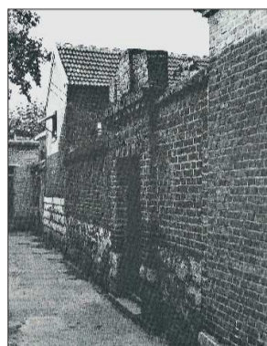
▲1921年夏,党领导建立的山东第一个工会组织——津浦铁路机车厂工人俱乐部旧址(今济南大槐树北街57号)。