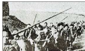
▲济南战役结束后,山东人民在党组织领导下继续支援大军南下,参加淮海、渡江等战役,为全国解放做出了重大贡献。图为浩浩荡荡的担架队。