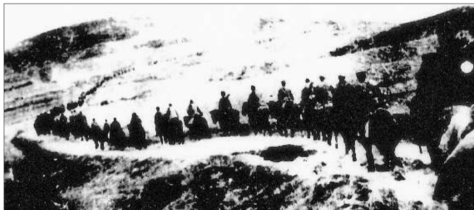
▲1938年12月,鲁东游击第八支队编为八路军山东纵队第八支队。图为第八支队奉命由清河区开往沂蒙山区。