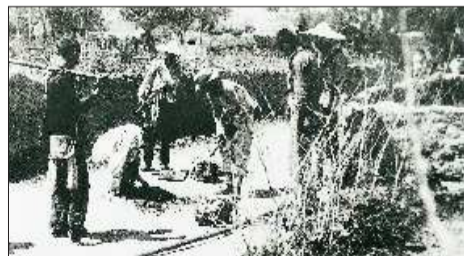
▲山东海阳的地雷战闻名全国。8年抗战中,海阳民兵共作战200余次,涌现出于化虎等大批英雄模范人物。图为民兵们把地雷埋到敌人的必经之路上。