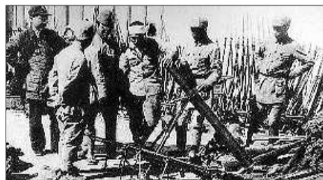
▲成立于1940年1月25日的铁道游击队,在百里铁道上与日伪军展开殊死搏斗,令敌人闻风丧胆。