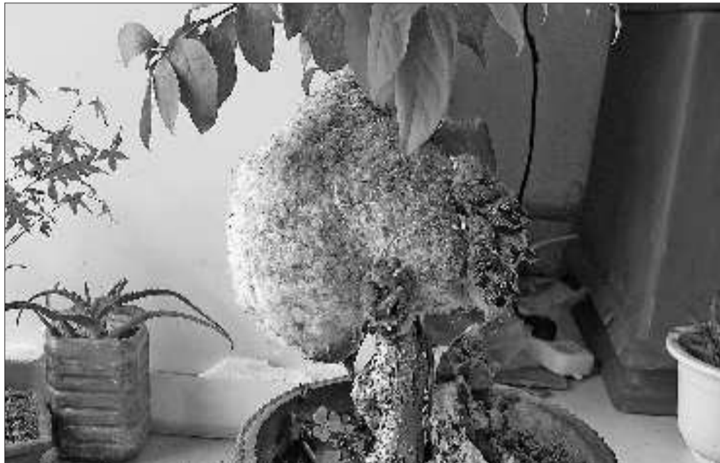
幼鸟趴在鸟巢外休息。

本报6月30日讯(记者 贺超) 6月30日,市民何先生拨打本报热线8308110,称在树林内发现了一个形状怪异的鸟巢,鸟巢内还有4只幼鸟。目前4只幼鸟被喂养在何先生家中,待幼鸟长大后,便放归自然。