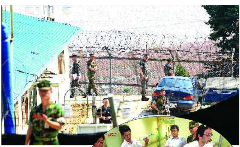
▲7月4日,士兵在韩国江华岛海军陆战队军营站岗。

海军陆战队发言人说,金姓下士与死伤者同属一个排,使用一支K-2步枪。这支部队士兵上哨时通常配发15发子弹,不清楚这名下士开了多少枪以及这个排当时有多少人在营地。下士走出营地,向一所建筑内投掷一枚手榴弹,建筑内当时没有人。