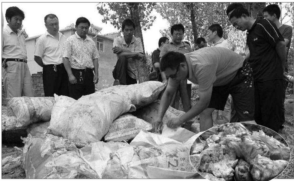
工商执法人员正在将2040斤问题猪肘集中销毁。

绿的现象。这种肉如果储存时间过长或者冷藏温度稍高即可导致肉色灰暗,外表及切面潮湿而发粘,脂肪变黄,甚至出现异味。工商部门提醒消费者购买时需谨慎选择。