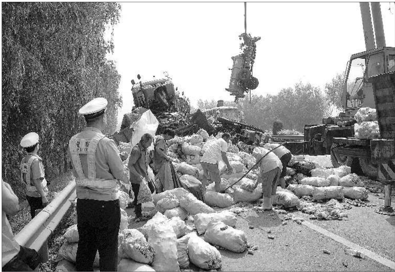
▲执勤交警协助吊车清理路面。