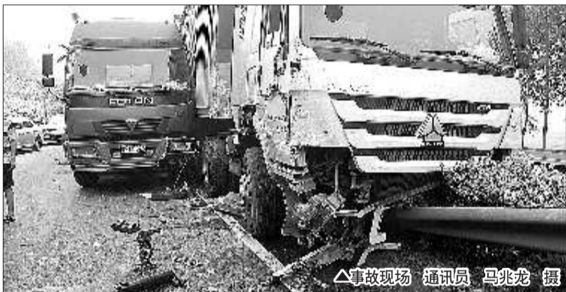
▲事故现场

事发后,菏泽交警及高速公路管理部门对事发路段第一时间实行了交通管制,临近的高速路收费站均采取了分流措施,初步清理后,事发路段实行了借道通行。上午11时许,路面全部清障完毕。