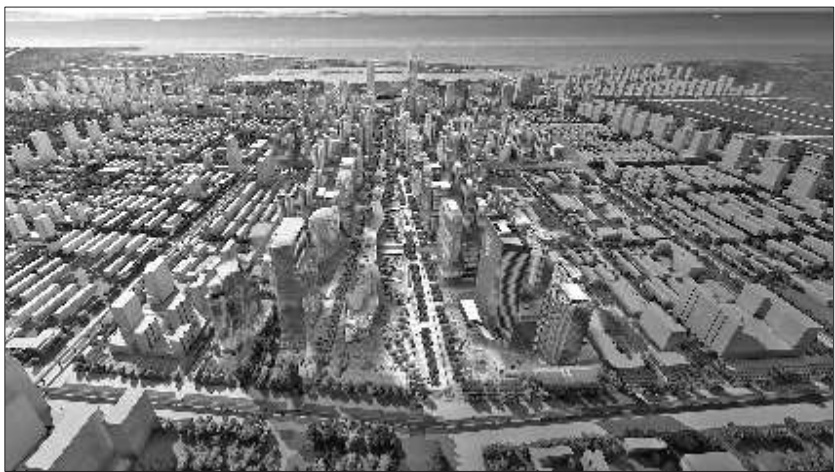
中心商务区淄博路地段全景图