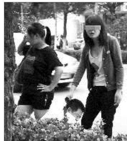
陈小姐和表姐将男子拦在路边。

“事不大,该看病的看病,出了事想跑就不对了。”白衣男子的说法很难自圆其说,围观群众纷纷指责,随后110民警赶到现场进行处理。