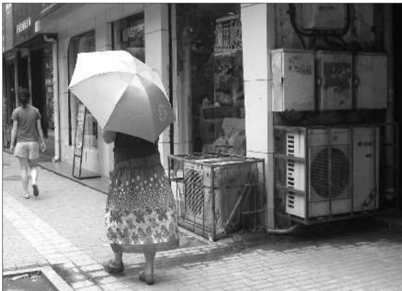
空调外机排出的冷凝水流到了人行道上。

随着夏天的到来,在人们日常生活和工作中,空调的使用越来越广泛。但是,不少市民在享受空调的时候,只顾自己舒适,不顾他人感受,有的任冷凝水乱排乱流,有的任热气乱喷,有的噪音扰民……这些不文明行为,不仅对其他市民的日常生活造成了影响,同时也一定程度上损害了城市的文明形象。