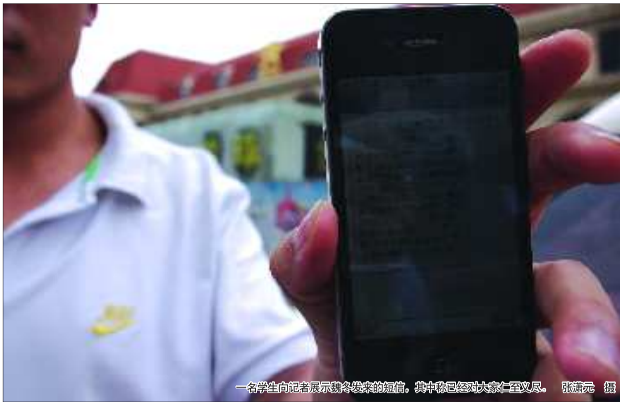
一名学生向记者展示魏冬发来的短信，其中称已经对大家仁至义尽。

“青岛知名企业包吃住，每月工资2000元，加班还有1.5倍工资……”这份经同学介绍的工作待遇丰厚，让山东经济学院和济南大学的上百名同学动了心。11日，学生们到了黄岛才得知，去的并非知名企业，而是分散的小作坊，这让学生们十分不满，介绍工作的同学却人间蒸发。