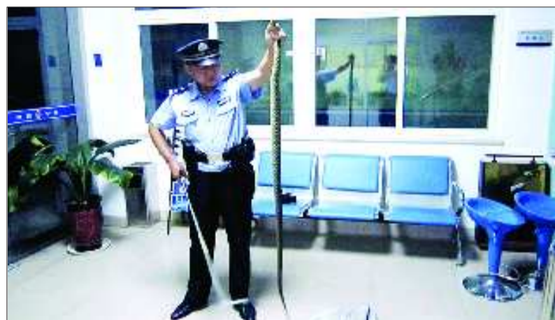
民警捕获的花蛇长近两米。

本报96706热线消息(记者 尉伟) 7月11日深夜,一条近两米长、如鸡蛋粗细的花蛇趁夜溜进西光明街一居民院“遛弯”,花蛇倒是悠闲了,院里的四五户居民吓得可是不轻快。槐荫巡警赶赴现场后,用专业捕蛇工具与花蛇缠斗了近半个小时,才将其抓获并顺利“请”出大院。