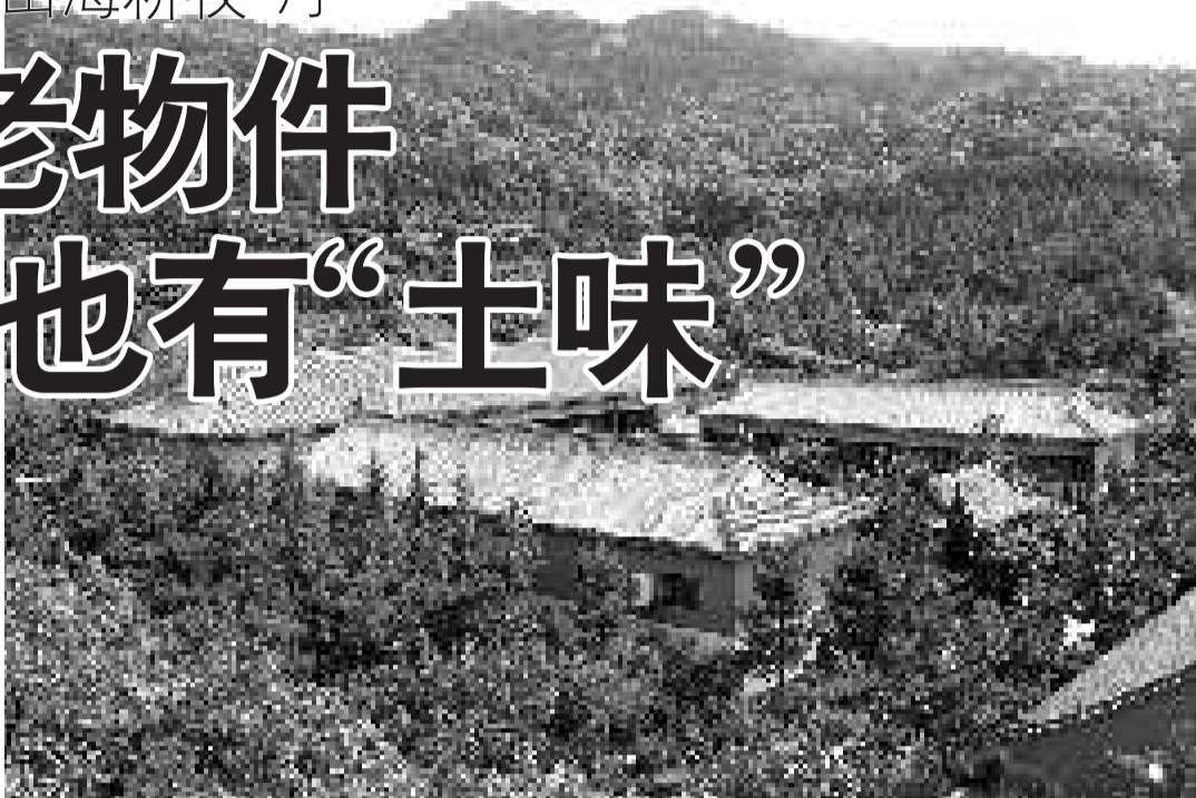
一座四合院,浓缩保存一片土地数百年的民风习俗。

在民俗馆内,300平方米的“山海耕牧”馆汇集了募自荣成民间的500余件新旧生产工具,加上简单说明,间接展示着当地的农业、渔业生产场景。