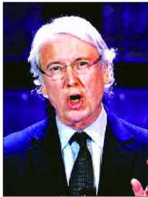
道琼斯集团前首席执行官辛顿