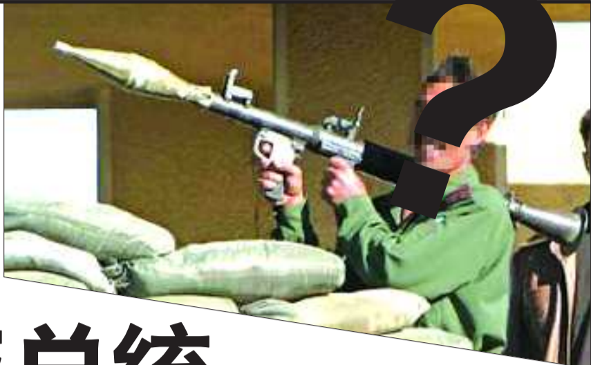
▲袭击人员身份尚不能确定。