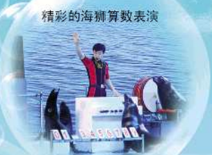
精彩的海狮算数表演