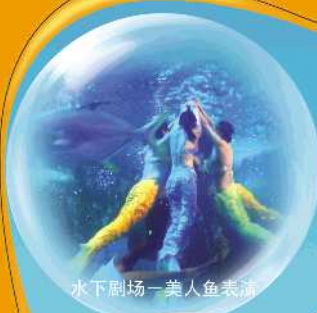
水下剧场—美人鱼表演