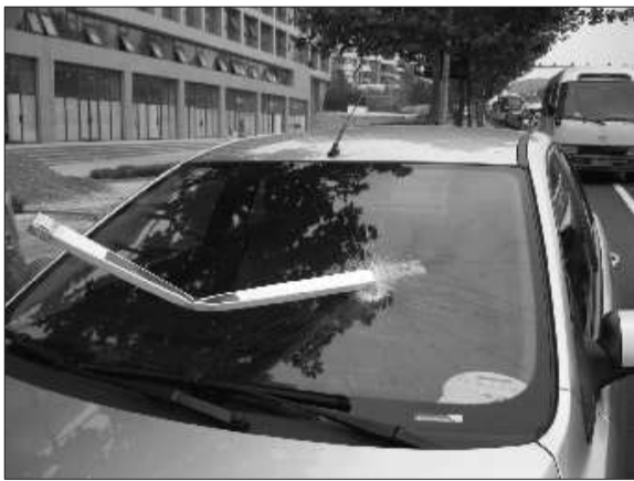
▲现代车和大众车均受损严重。