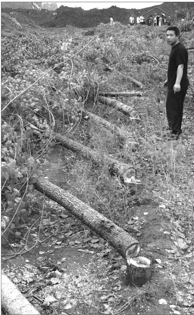
▲ 宋其武无奈地看着自家被锯的杨树。

中午11点半左右,记者来到泰山公安局上高派出所了解情况,值班人员说,出警的民警已经换班回家,如果了解情况要等到20日上班后。