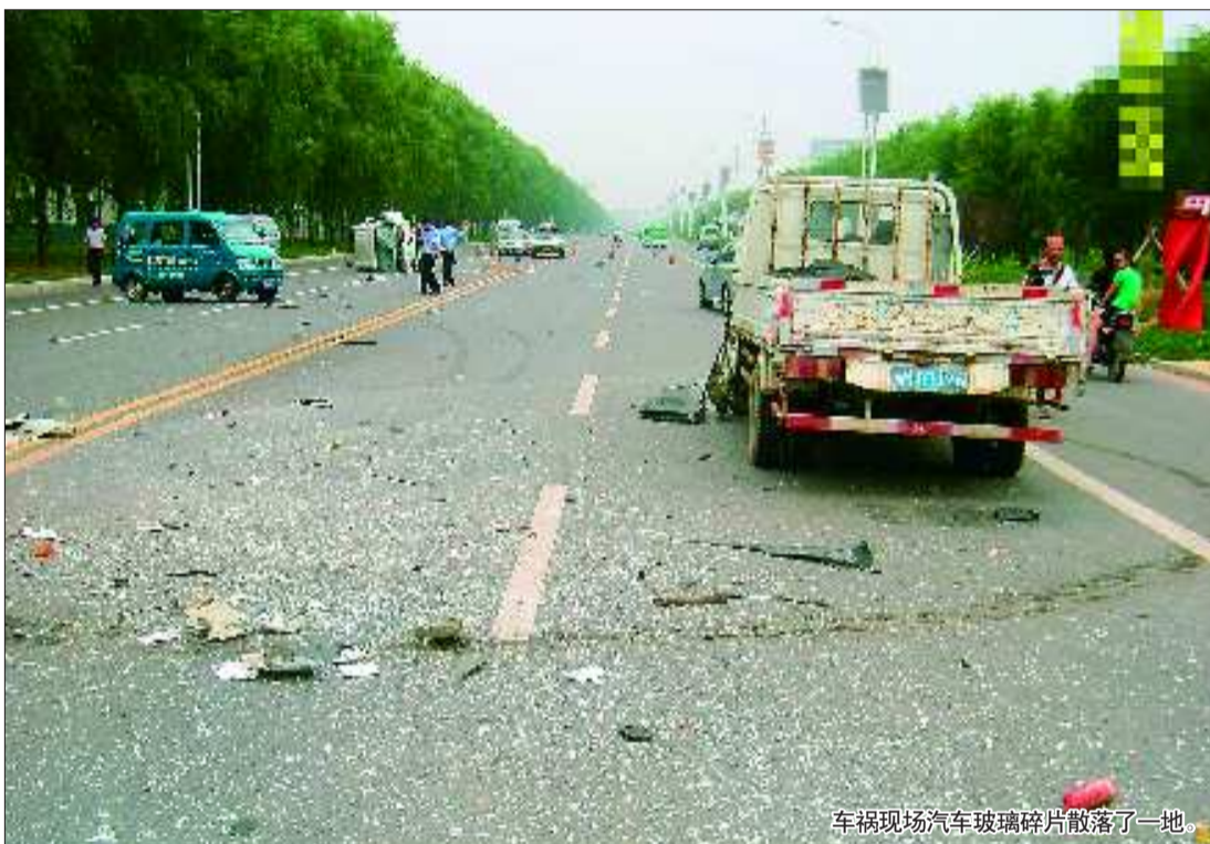
车祸现场汽车玻璃碎片散落了一地。

目前, 德州市盐务局稽查支队已与公安和交通部门建立协作制度, 主要解决涉及盐业违法案件的“路查封控”及边界渗透问题, 对坚守好山东盐业市场北大门起到积极的作用。另外, 市盐政稽查支队正与河北衡水盐政处联合落实私盐的销售终端。