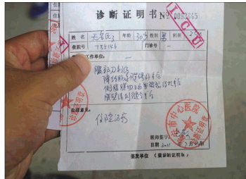
▲两名受伤严重男子的诊断书。