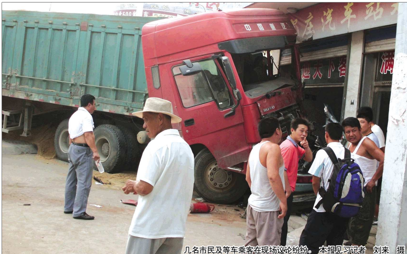
几名市民及等车乘客在现场议论纷纷。

本报96706热线消息(见习记者 刘来) 7月23日上午,肥城市济南路与泰东路交叉口发生一起车祸,一辆装满沙子的重卡撞到了另外一辆拉着钢管的重型挂车车尾,随后重卡冲向路北的安驾庄汽车站候车厅,将一辆在门口等客的出租车撞出去近两米远,造成出租车司机及一名路边走行人当场死亡。