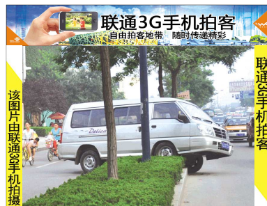
23日下午,一车主将一辆银白色面包车停放在龙潭路神龙龙技校门口,因未拉手刹,面包车溜车后卡在了绿化带石阶上。