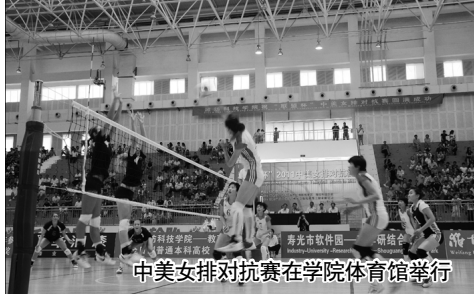
中美女排对抗赛在学院体育馆举行