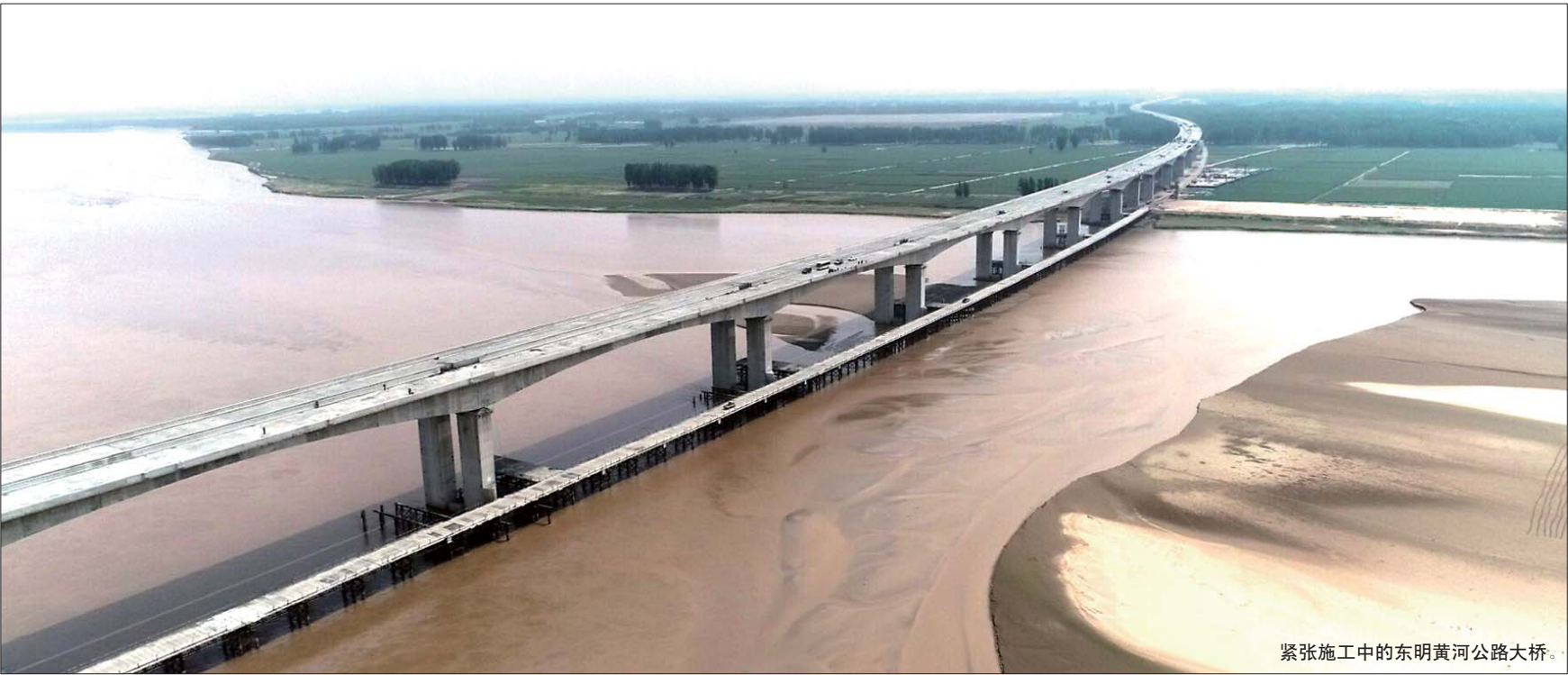
紧张施工中的东明黄河公路大桥。