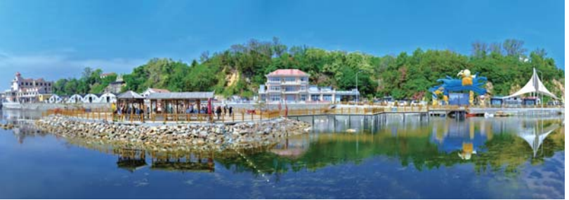
三等奖:《海滨公园》 张翠玲