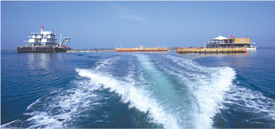
二等奖:《汇悦一角》 孙风云