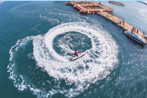
▲获奖作品《致富泉眼》邹存良 摄