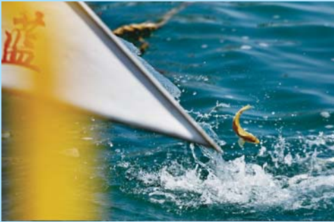
▲获奖作品《归去来兮》