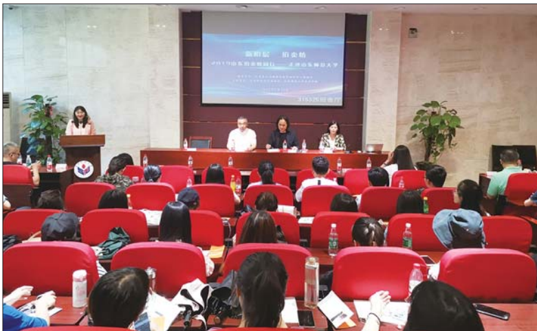
▲“2019山东拍卖校园行——走进山东师范大学”活动在千佛山校区举行