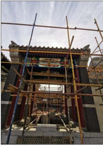
屋顶文化公园八大传统建筑之北京四合院。