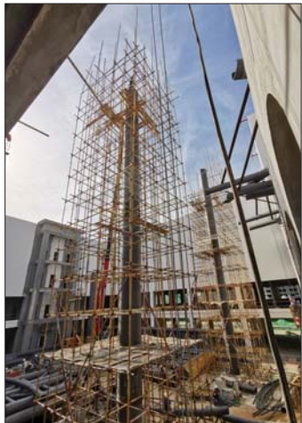
中华祥云景观安装中。