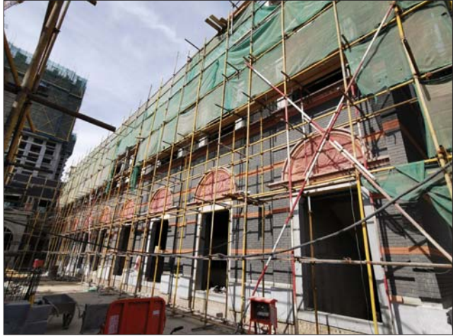
屋顶文化公园八大传统建筑之上海石库门。

还有屋顶公园祥云部分以及设备安装未到位;东区主题结构封顶,消防设备安装正在进行,同时各区域内部装修正在进行,屋顶文化公园已经雏形初现。 从一次次的节点瞩目到眼下的竞相花开,万达广场·欢乐小镇的“地标”速度与“铁军”精神让全体市民倍感振奋,来自天南海北的工作人员扎根江北,奋战于此,用责任与匠心诠释行业精神,用数百个日日夜夜奋力书写答卷。 眼下的万达广场·欢乐小镇既如一位端坐帐中,运筹帷幄的将军,又如一位藏在深闺的大家闺秀,围挡拆除之时,项目的盛世华章即将开启,外在磅礴,内有锦绣的一处全新商业新地标将呈现在世人眼前,在惊叹于恢弘壮丽的景象之余,更能满满品味内在千秋。 瞩目10月19日,一起见证城变! (文/张超)