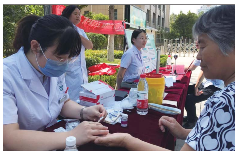
通过现场义诊，帮助居民了解身体状况。

本报济宁6月25日讯(记者 孔茜) 23日，济宁高新区洸河社区卫生服务中心家庭医生携手济宁市第一人民医院专家，走进阳光盛景园进行集中咨询义诊活动。活动以“携手家庭医生、共筑健康生活”为主题，通过现场家庭医生签约、免费义诊、发放宣传材料等方式，进一步提升“家庭医生签约”政策知晓率，增强老年人健康意识，提高居民获得感和满意度。 当日清晨，位于阳光盛景