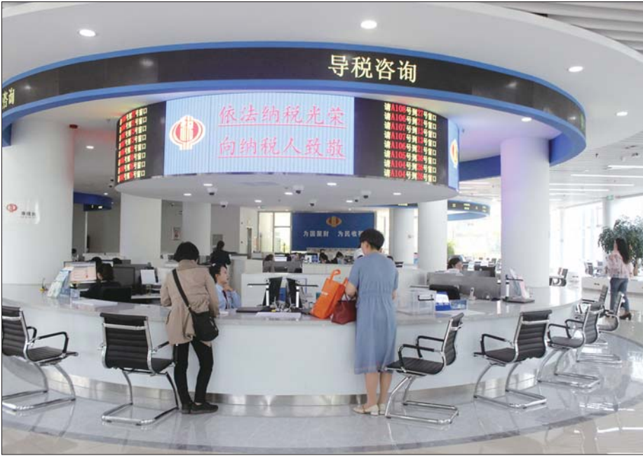
行政许可事项审批时限提速。

2019年,济宁高新区在关系发展大局和民生福祉的各个领域都取得了新进展,预计全年营业总收入突破3500亿元大关,GDP增长5.1%、增幅位居全市第一,年初既定的各项指标顺利完成,主要经济指标全市领先。 过去一年,高新区动能转换起势见效。随着“双百工程”的顺利推进,先后举行7次集中开工、3次作为全市主会场,112个新项目破土动工,54个项目竣工投产,新开工项目、新投产项目、新上四新项目个数、增幅“双领先”,省重点项目、省优选项目个数分列全市第一,全区动能充沛的强大活力充分体现。 改革活力竞相迸发。2019年,高新区以制度创新、流程再造增创高新先发优势,通过“管委会+公司”、大部制、全员聘任、绩效考核等系列改革举措,树立了正负激励鲜明导向,带来了千