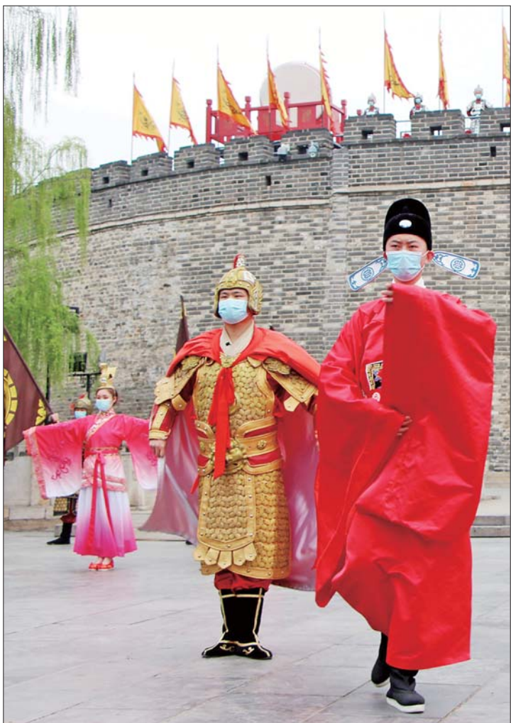
三孔景区举行开园仪式。

齐鲁晚报·齐鲁壹点记者 姬生辉 张晓燕 夏侯凤超 见习记者 康岩 通讯员 梅花 陈曙光 张艳 稿件统筹 时培磊