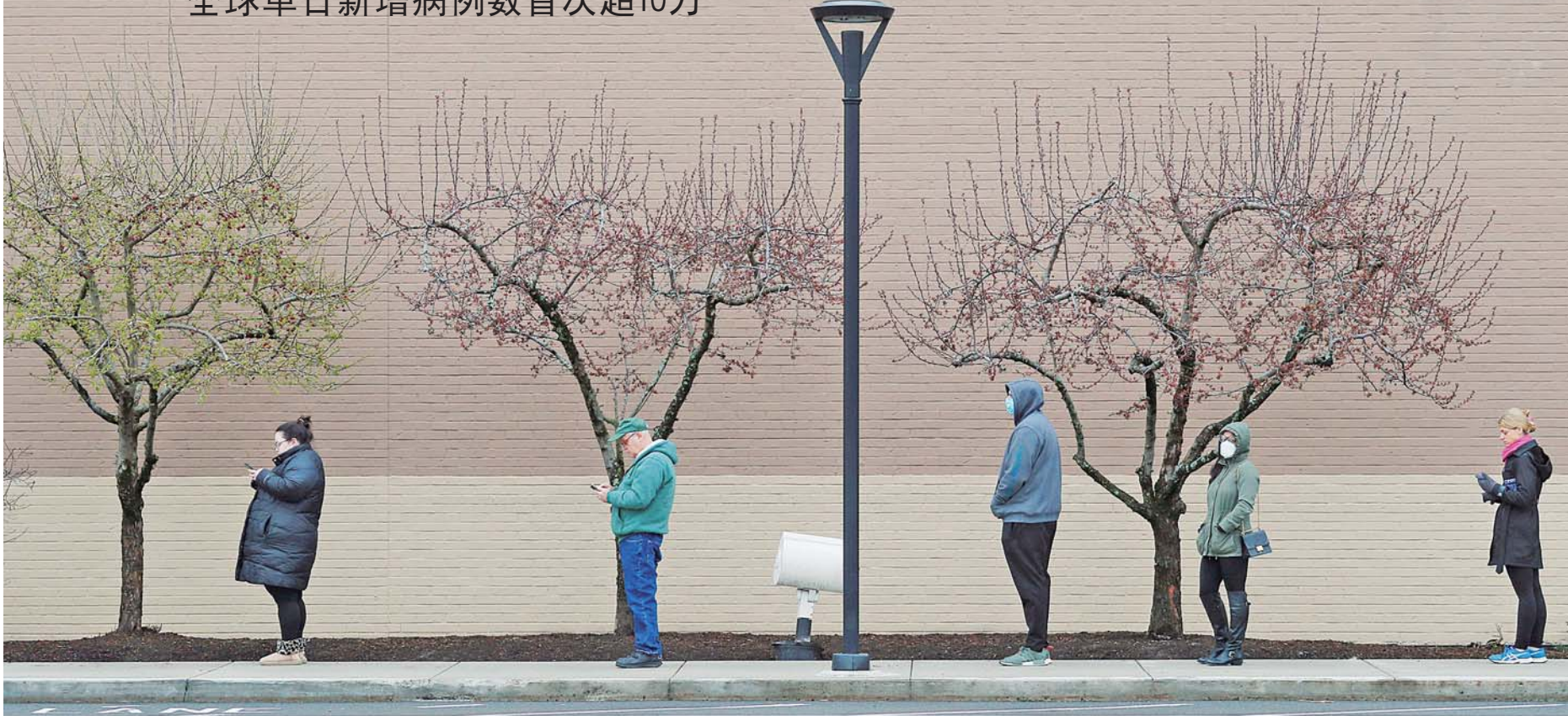
4月4日,在美国马萨诸塞州梅德福,市民保持安全距离排队等候进入一家百货商店。

数据显示,全球4日新增确诊病例超过101500例。截至美国东部时间5日2时44分(北京时间5日14时44分),全球累计确诊病例达1203923例,累计死亡64795例,累计治愈247273例。