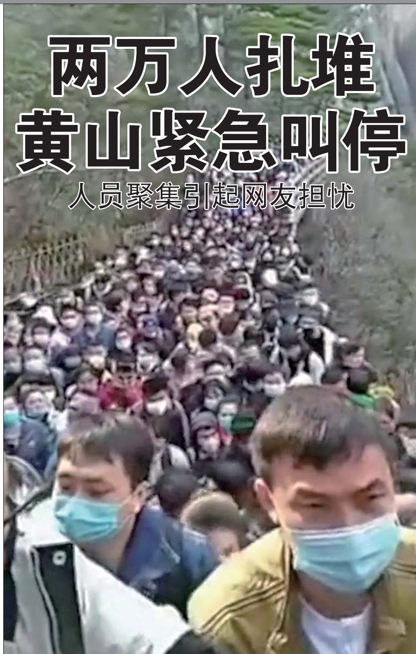
清明小长假里,大批游客拥进黄山景区。网络视频截图