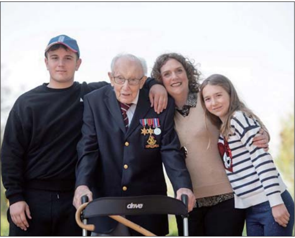
穆尔和女儿(右二)、外孙、外孙女在一起。

4月27日,英国首相约翰逊重新上班,他在伦敦唐宁街10号首相府外发表讲话时提到一位英雄——99岁的汤姆·穆尔,这位二战老兵4月初在募捐网站上发起一项健走挑战,为英国国家医疗服务体系(NHS)筹款。彼时,他从未想过自己会受到全球关注,甚至筹募到一笔足以创下世界纪录的善款——3279万英镑。4月30日是汤姆·穆尔100岁生日,包括英国女王的贺卡在内,14万张来自全球各地的贺卡涌向这位老英雄的家,赞美他至今仍在为国“战斗”。