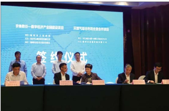
招商引资项目集中签约。