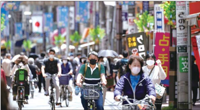
1135443 5月24日,人们骑车经过日本东京的购物街。

据新华社消息 日本官员24日说,日本政府计划从25日开始解除首都圈4都县和北海道的紧急状态。这标志着日本47个府全部解除紧急状态。