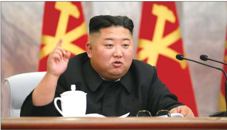
金正恩出席朝鲜劳动党第七届中央军事委员会第四次扩大会议。

据朝中社24日报道,朝鲜劳动党第七届中央军事委员会举行第四次扩大会议,朝鲜劳动党委员长、朝鲜劳动党中央军事委员会委员长金正恩主持会议。会议提出了进一步夯实国家核战争遏制力、保持高度动员状态运营战略武装力量的新方针。