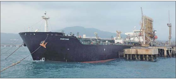
当地时间5月25日,伊朗油轮“财富”号停靠在委内瑞拉码头。 据中新网

金融市场数据供应商路孚特·艾康公司的数据显示,“财富”号当地时间25日凌晨1时左右抵达埃尔巴利托港。委内瑞拉国家电视台播放了“财富”号油轮驶过加勒比海水域的画面,委内