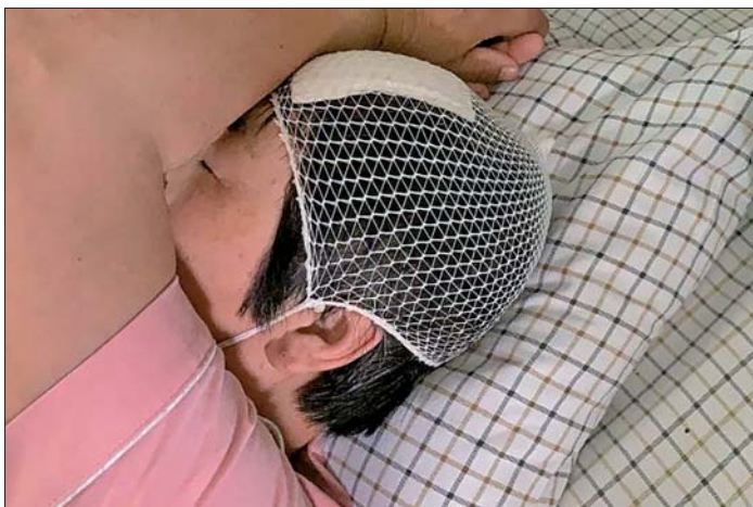
◀受伤的高女士仍在住院治疗。