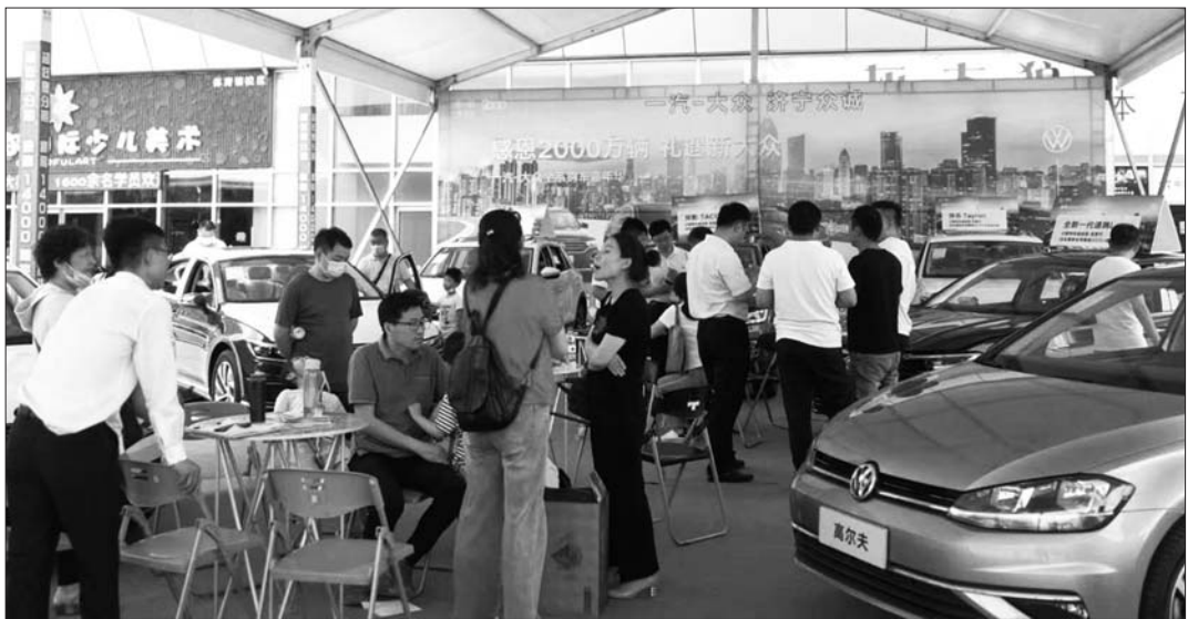
客户与参展经销商商讨购车细节。

齐鲁车展系疫情后山东地区首场大型综合车展,曲阜师范大学管理学院教授张应语告诉记者,汽车行业是制造业的标杆,汽车行业的强大与否,代表着制造业的强大与否,汽车强,则制造业强,汽车兴,则制造业兴。2020年汽车行业最重要的事就是“促进消费”,车展是车市风向标,线下车展活动向消费者全方位展示行业新动态、新工艺、新理念、新车型,对品牌的口碑传播、认可度的提高、美誉度的提升等具有重要意义,这无疑也会拉动汽车消费。