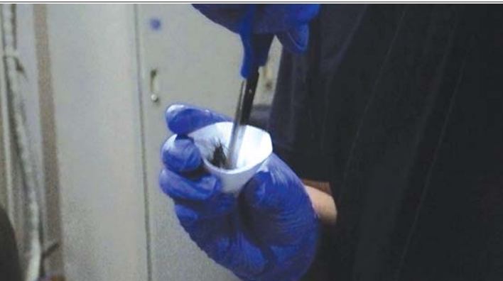
▲除了尿检,警方还会对涉毒嫌犯进行发检。