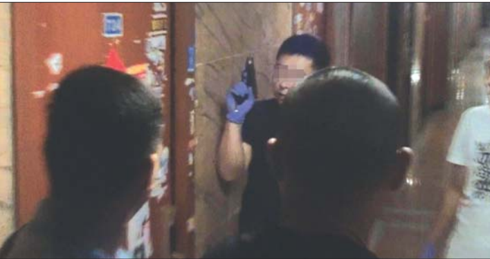
和平路某小区,民警包围涉毒嫌疑人所在的房间。