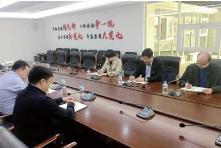
▲图为区纪委监委班子成员到联系镇街开展廉政谈话。

为防止“按下葫芦浮起瓢”,针对发现的问题,区纪委监委深化源头治理,探索建立“管用、管常、管久”长效机制,用制度固化作风建设成效,形成完整的工作“闭环”。一方面督促相关部门出台规范性文件。针对发现问题,要求相关部门进行整改的同时,督促行业主管部门、主责部门建立全区适用性的规章制度。例如,对于区教育会计核算中心典型案件