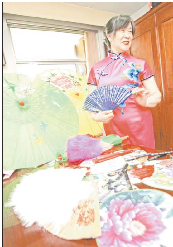
穿什么样的旗袍就得拿什么样的配饰。