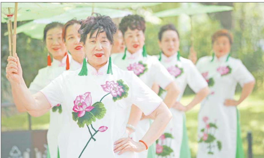
最美的舞者，最美的夕阳红。