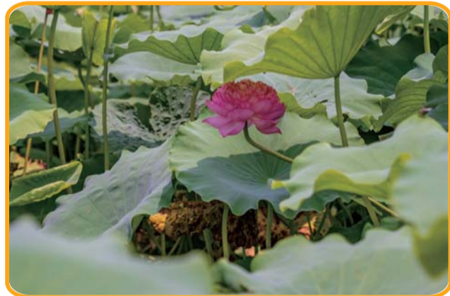
不同的绿叶间,荷花的样子也是不相同的。

楼阁,花船栈桥,风光优美,如诗如画,夏天的清晨、午后或傍晚漫步湖边,细赏清雅悦目的花容,轻闻清幽雅适的香气,令人神清气爽,陶醉其中,让人流连忘返。