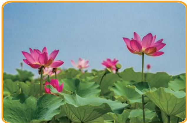
荷花映日,莲叶田田。