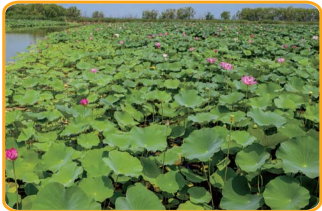
一大片荷花竞相开放,美不胜收。