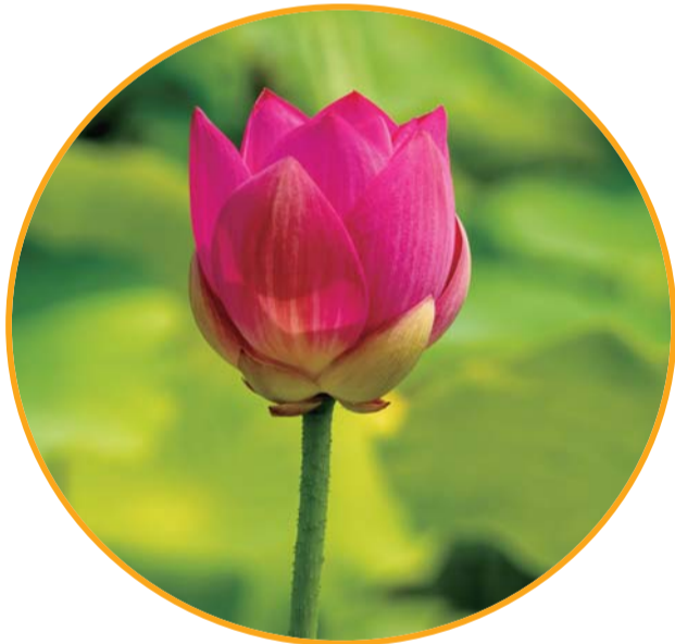
含苞待放的荷花苞也显得清新。

景区随手拍一个画面都美的能当壁纸,上万亩的荷塘连绵的荷叶在风中舞动,白的、粉的、红的荷花点缀其中,还有偶尔从荷叶中窜出来的白鹭,一切美的令人迷醉。亭台