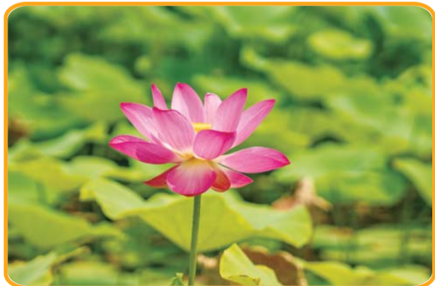
荷花似乎在娇羞绽放。