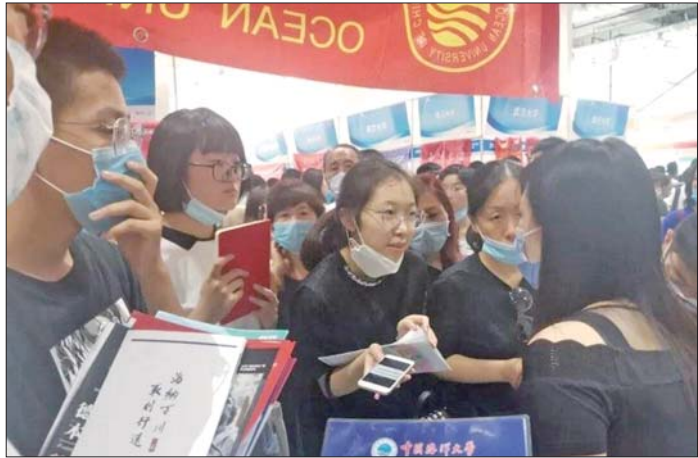
7月28日,在11市同步举办的高招会吸引了众多考生和家长。

动。一位学生家长一大早就从微山开车赶了过来,“今天孩子没过来,我替他看看学校,心情还是比较激动的,这么多高校过来,一下子还真有点眼花缭乱,得好好向招生老师咨询咨询。”