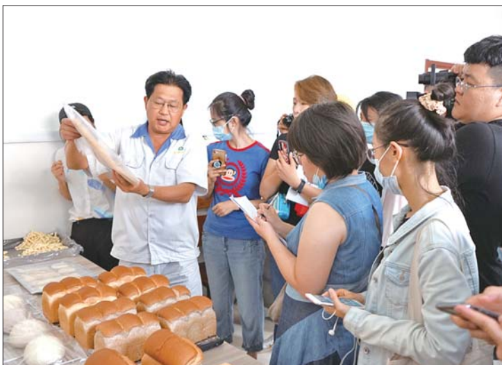
媒体采访团在金浩面粉采访该公司新品研发。

“道不尽齐鲁粮油好”2020全媒体山东行首站于8月12日至15日成功举办,媒体记者走进聊城、菏泽、济宁、泰安等地的多