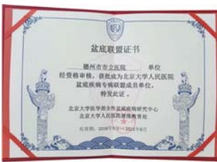
妇科获“北大人民医院盆底疾病专病联盟”资质