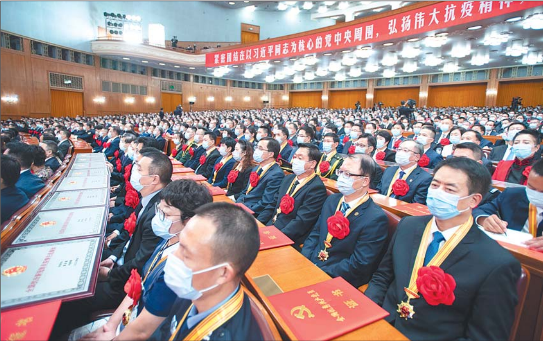
9月8日上午,全国抗击新冠肺炎疫情表彰大会在北京人民大会堂隆重举行。